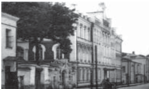
Смоленское Александровское реальное училище

училище; переезд в Петербург в связи с поступлением на сельскохозяйственные курсы, затем в Ревель (Таллин), откуда на пароходах торгового флота избороذил все моря и океаны.