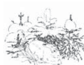
д. Кислово. Начало XX века

«Из светлого родника материнской и отцовской любви вытекал искрящийся ручеек моей жизни»** *