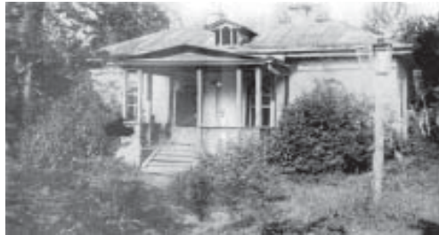
Так выглядел дом в Кислово в 20-е годы прошлого столетия

Иван Сергеевич Соколов-Микитов родился 18 мая 1892 года в урочище Осеки под Калугой. Спустя три года семья переехала на Смоленщину, в небольшое имение Кислово (ныне территория Угранского района).