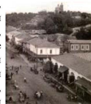
г. Дорогобуж. Начало XX века

Вернувшись со службы, Соколов–Микитов некоторое время учительствовал в Дорогобуже, путешествовал по югу России, где невольно был втянут в события Гражданской войны. Позже ходил в плавание на шхуне «Дыхтау», участвовал в экспедиции