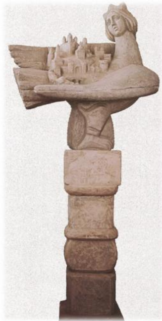
Ельчанинова Л.А. Птица Феникс. 1990